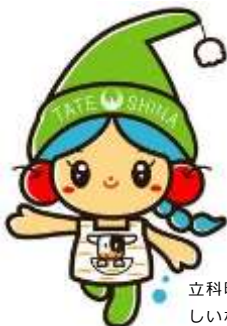
立科町マスコットキャラクター しいなちゃん

関連する資料：添付資料「蓼科高校授業風景」 立科町公式ウェブサイト http://www.town.tateshina.nagano.jp