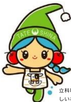
立科町マスコットキャラクター しいなちゃん

立科町公式ウェブサイト http://www.town.tateshina.nagano.jp