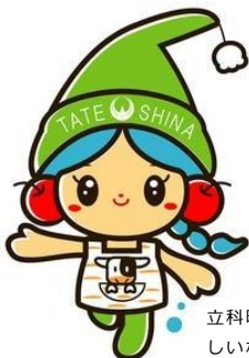
立科町マスコットキャラクター しいなちゃん

添付書類：会場案内図 立科町公式ウェブサイト http://www.town.tateshina.nagano.jp