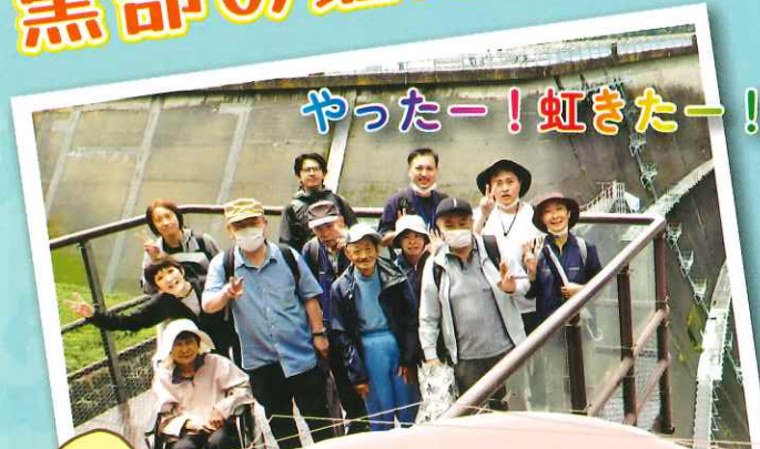
やったー！虹きたー！

虹の写真は撮れませんでした、放水された水にきれいな虹がかかっていてとてもきれいでした。