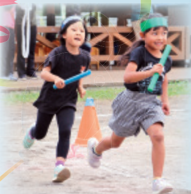
あきらめない心で! ~One team!~