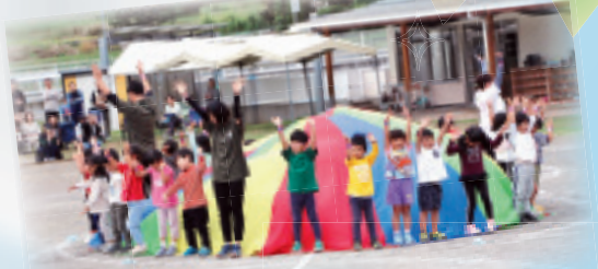
ひろがれ! にじいろのわ