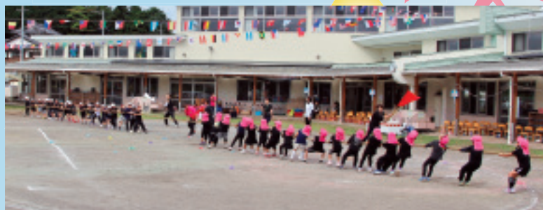
真剣勝負! ~ぞうときりんの力くらべ~