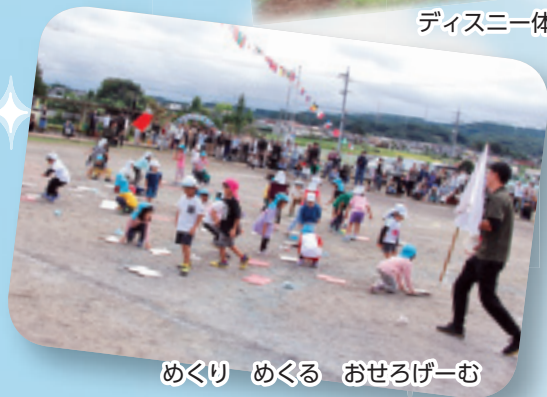
めくり めくる おせろげーむ