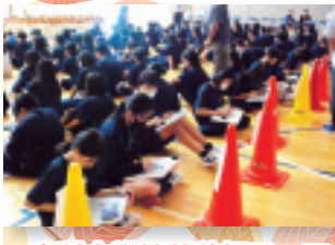
立科中学校蓼秋祭テーマ 勝発笑美戦 (かつばえびせん)