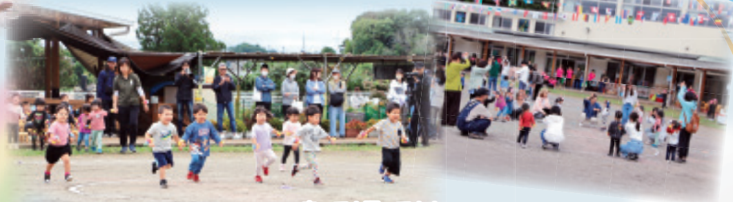
走って! 跳って!! Baby Shark♡