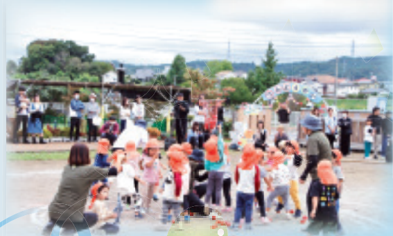
たくさん 入るかな?